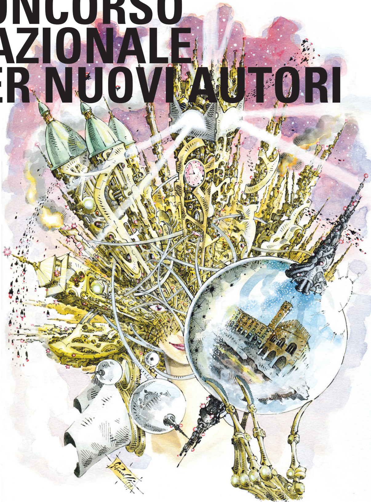
Illustrazione: Giacomo Porcelli • Grafica: spazioputnik.it